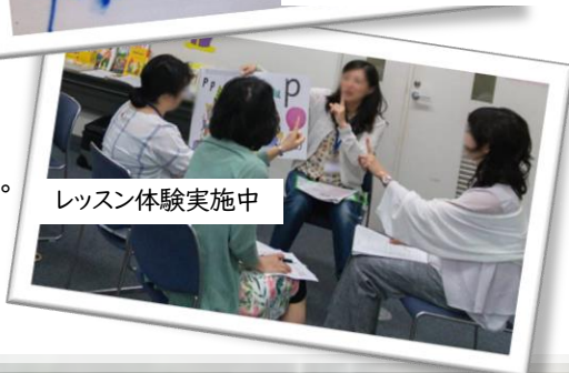
レッスン体験実施中

LD をもつ小 5 児童 ジョリーフォニックス教材 で約 4 時間の学習時点 聞いた「単語の音」から 自分で書き取り