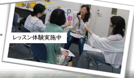
レッスン体験実施中

LDをもつ小5児童 ジョリーフォニックス教材で 約4時間の学習時点 聞いた「単語の音」から 自分で書き取り