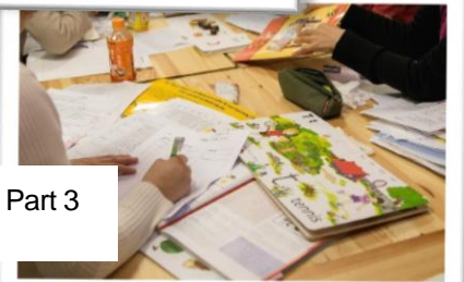
トレーニング Part 3 授業案作成中

LD をもつ小 5 児童 ジョリーフォニックス教材 で約 4 時間の学習時点 聞いた「単語の音」から自分 で書き取り